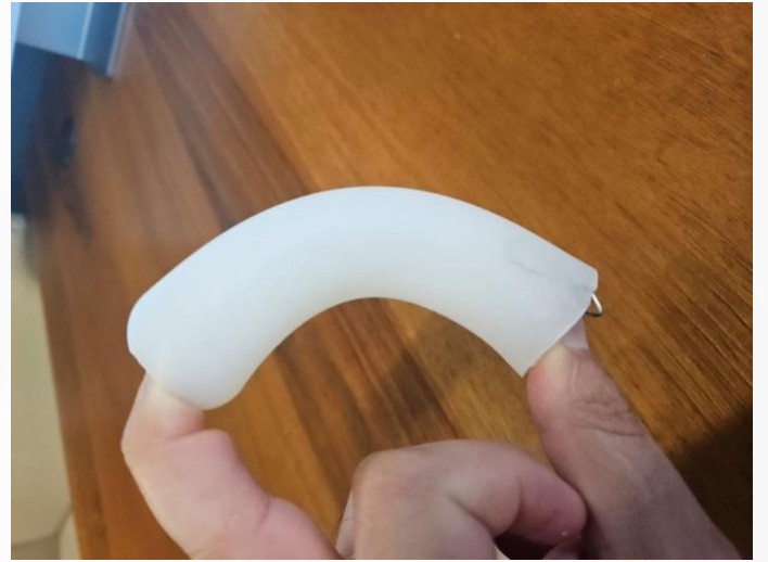
Resim 1. Yumuşak Silikon Mold